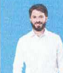
Marcelo Aro- Secretário de Governo e Secretário Chefe da Casa Civil de Minas Gerais