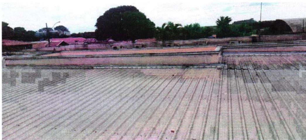
Foto 2 Análise do perímetro do telhado

As fotos acima descrevem a estrutura do telhado, composta por telhas de Zinco Galvanizadas. Houve uma certa dificuldade para a realização do trabalho, pois a estrutura do telhado apresenta certa instabilidade, em que a cada passo no telhado causava uma grande movimentação da estrutura.