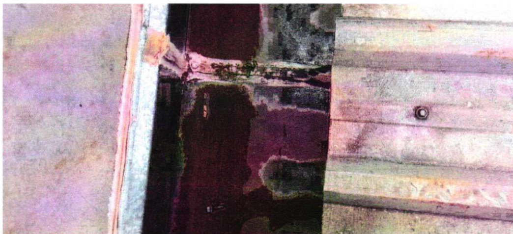
Foto 8 Análise da emenda feita nas calhas

Na foto pode se observar que o produto utilizado pra fazer a emenda (PU), necessita de reparo, visto que o mesmo já não atende as especificações de sua aplicação, que nesse caso era manter a união entre as calhas. Constata-se também a presença de ferrugem na calha. Que assim como todos os materiais passam por um processo de envelhecimento natural através da exposição de intempéries.