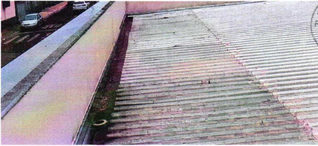
Foto 5 Análise das Calhas

As Calhas apresentam uma altura menor do que a recomendada, em relação a dimensão do telhado. Isso em chuvas com alto índice pluviométrico, podem gerar um acúmulo de desnecessário de água nas calhas.