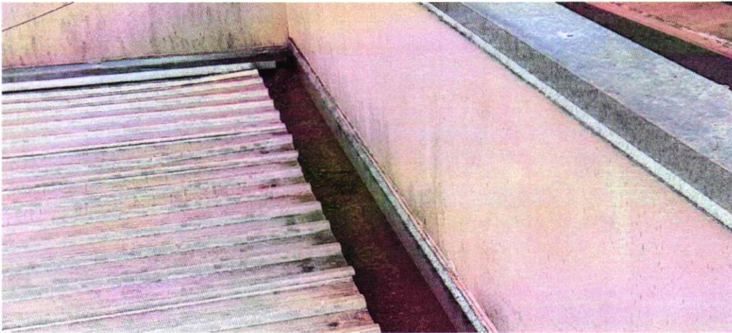
Foto 6 Análise da inclinação da calha

As Calhas apresentam uma altura menor do que a recomendada, em relação a dimensão do telhado. Isso em chuvas com alto índice pluviométrico, podem gerar um acúmulo de desnecessário de água nas calhas.