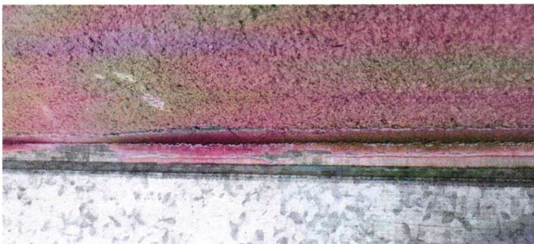
Foto 4 Análise dos Rufos

A foto descreve um percentual de inclinação utilizado inapropriado, favorecendo no acúmulo de água nas telhas.