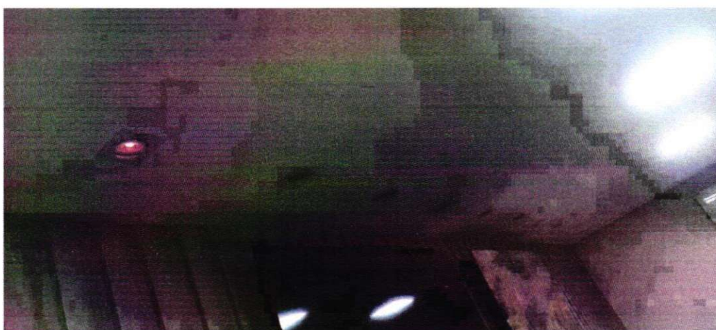
Foto 9 Análise da parte interna do Plenário

Na foto pode se observar que o produto utilizado pra fazer a emenda (PU), necessita de reparo, visto que o mesmo já não atende as especificações de sua aplicação, que nesse caso era manter a união entre as calhas. Constata-se também a presença de ferrugem na calha. Que assim como todos os materiais passam por um processo de envelhecimento natural através da exposição de intempéries.