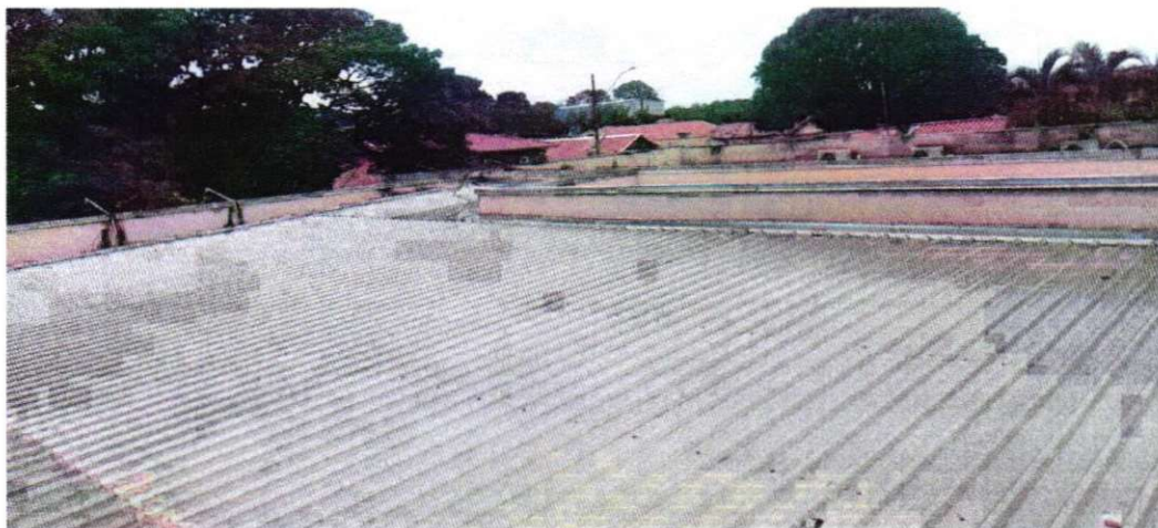
Foto 1 Análise do perímetro do telhado