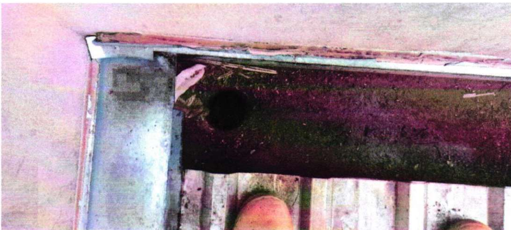
Foto 7 Análise do bocal e tudo de saída de água

A foto descreve a falta de inclinação correta da calha, prejudicando o escoamento da água da chuva.